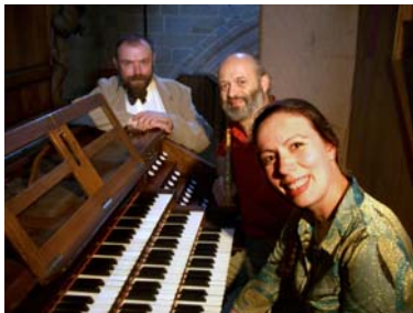
Cathédrale de Vannes

Ce programme invite à découvrir un répertoire de cantiques traditionnels, de mélodies anciennes, d'œuvres de compositeurs bretons (Ropartz, Langlais, Demars...) et des compositions originales mettant en valeur la sonorité puissante de cet instrument à anche double qu'est la bombarde, conjuguée aux possibilités infinies et aux couleurs chatoyantes de l'orgue. Une voix généreuse de baryton-basse vient compléter avec complicité cette rencontre entre l' "instrument du diable" et la musique des anges.